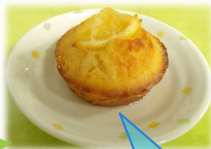
レモンマドレーヌ

7/10に「ささがせ茶屋」が開催されました。 7月のメニューは『レモンマドレーヌ』『天の川ゼリー』のいずれかを選択して頂き、季節の飲み物として『カルピス』をご用意させていただきました。